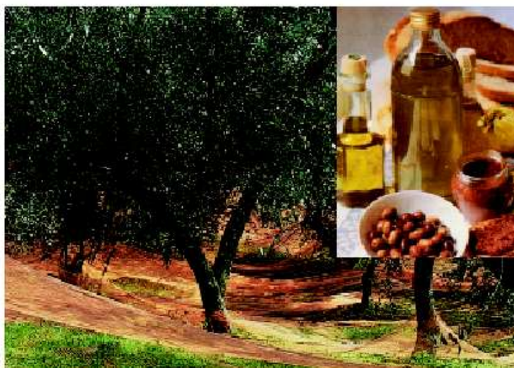
Ulivi ... olio e olive

1) euro 77.470,00 per i Comuni fino a 1000 abitanti